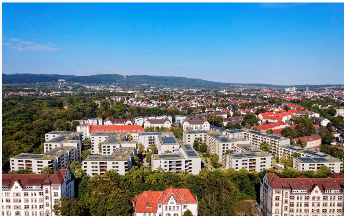
Visualisierung von oben