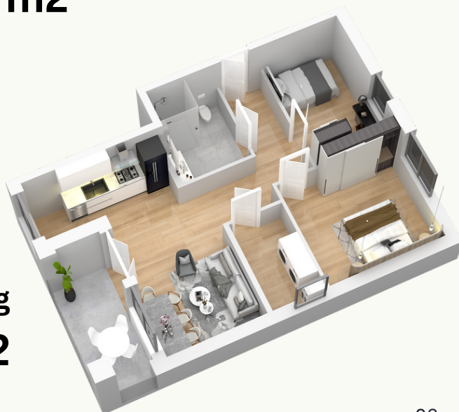
3-Zimmer-Wohnung 85 m 2