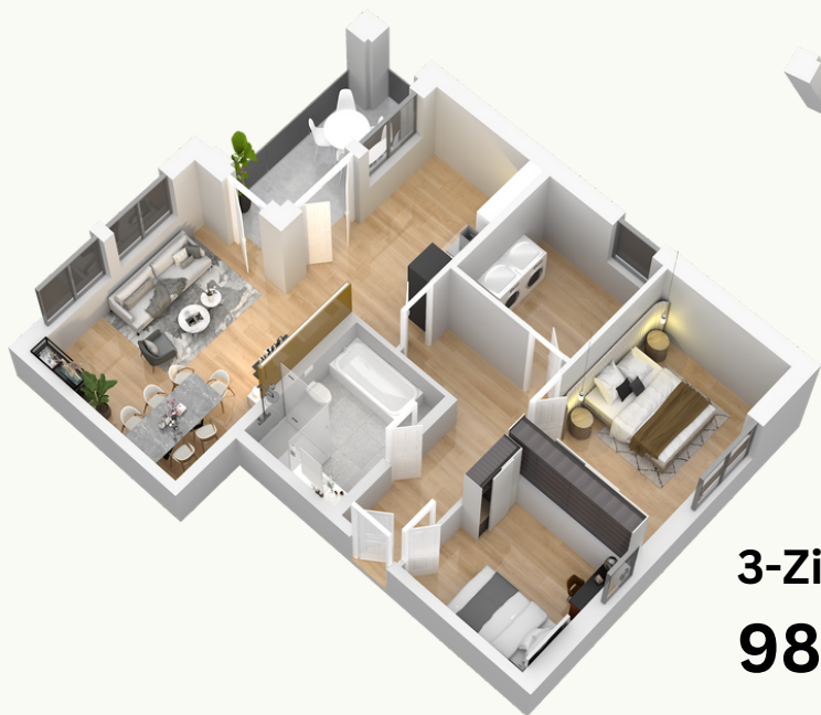
3-Zimmer-Wohnung 98 m 2