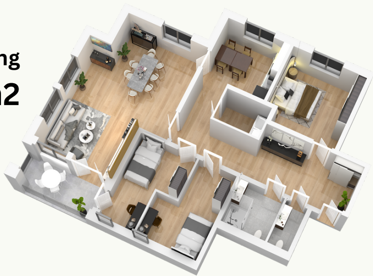
4-Zimmer-Wohnung 142 m 2