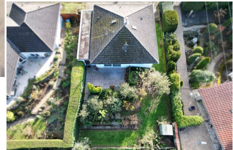
Luftbild Garten und Freisitz