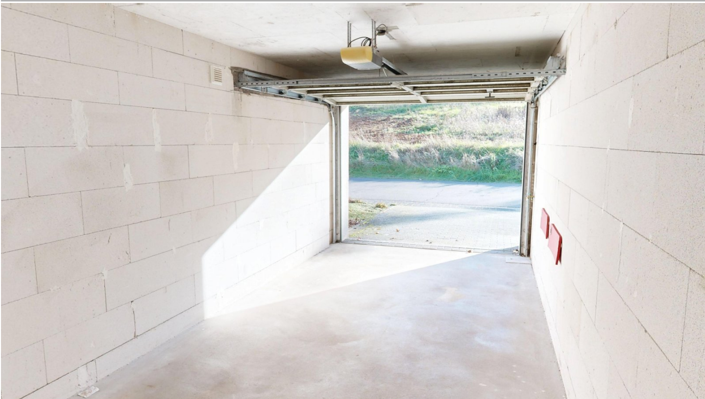
Garage mit Funk-Sektionaltor