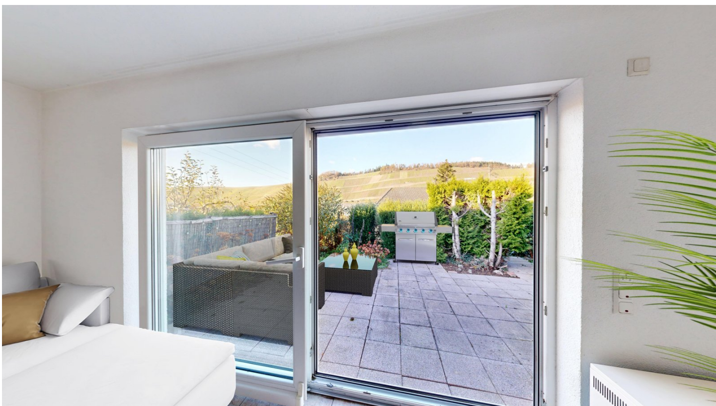
Ausgang zum Freisitz