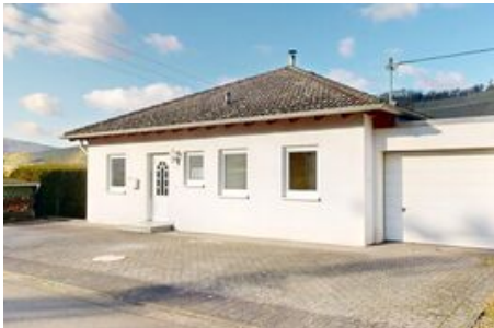
Garage und Stellplätze