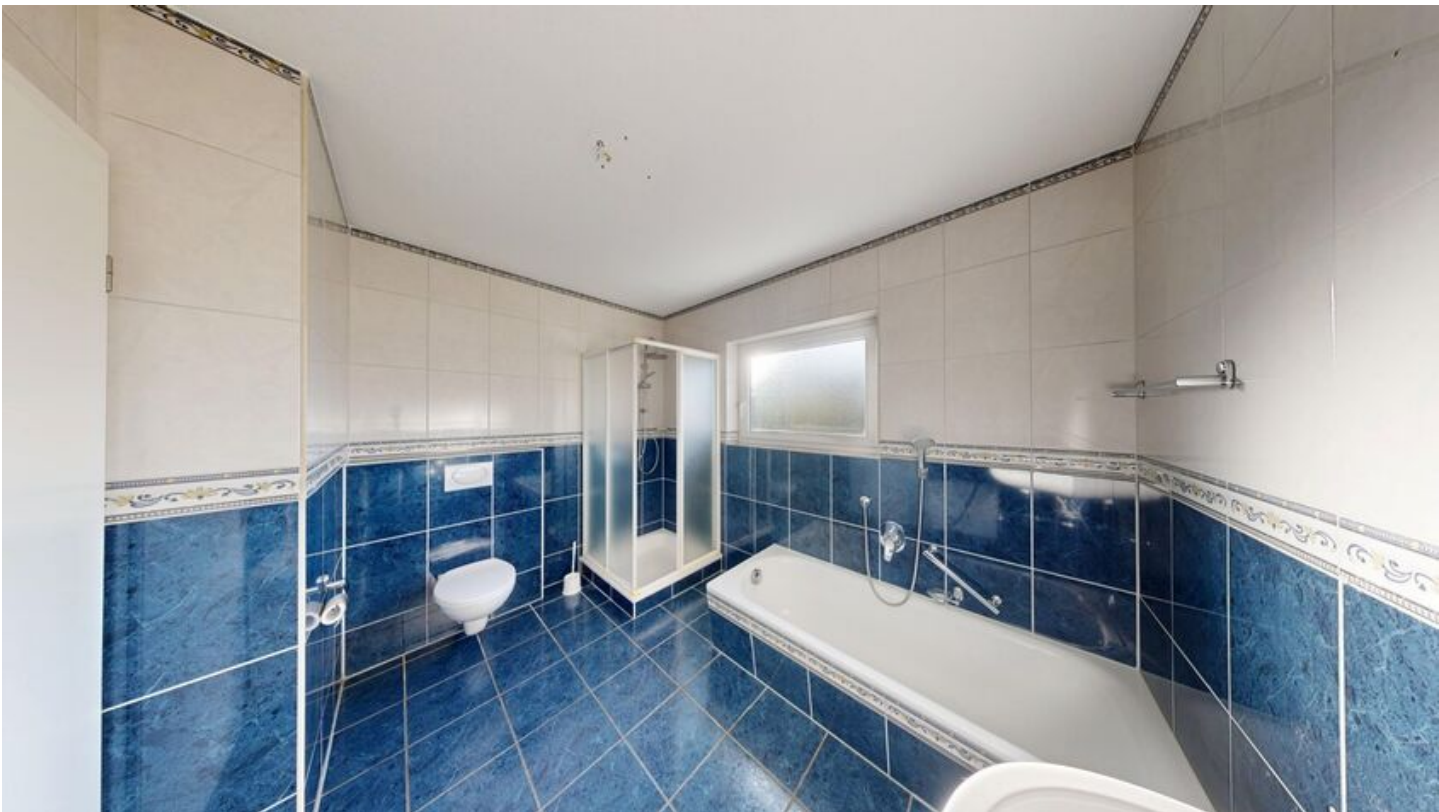
Bad mit Wanne und Dusche