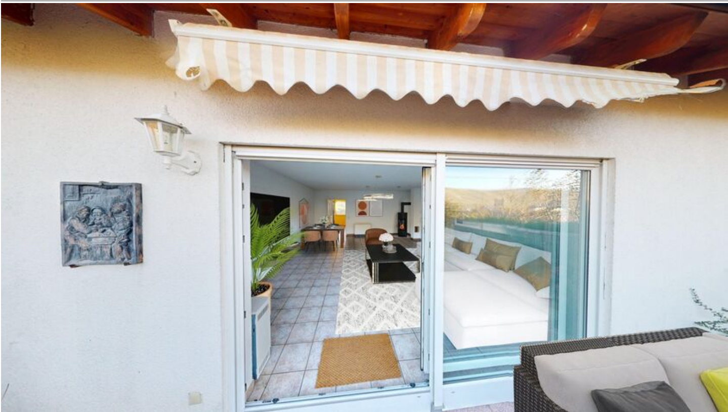
Freisitz mit Markise