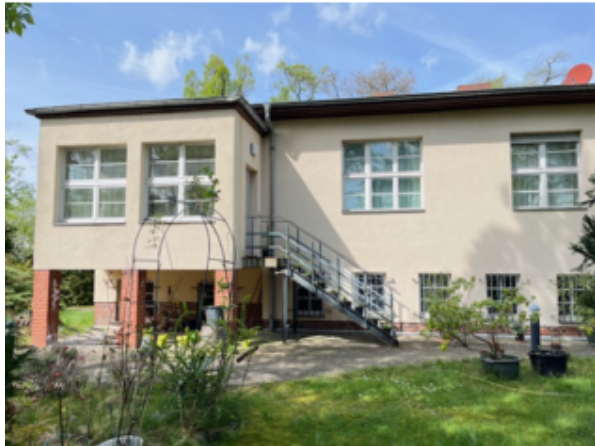
Ansicht zum Garten