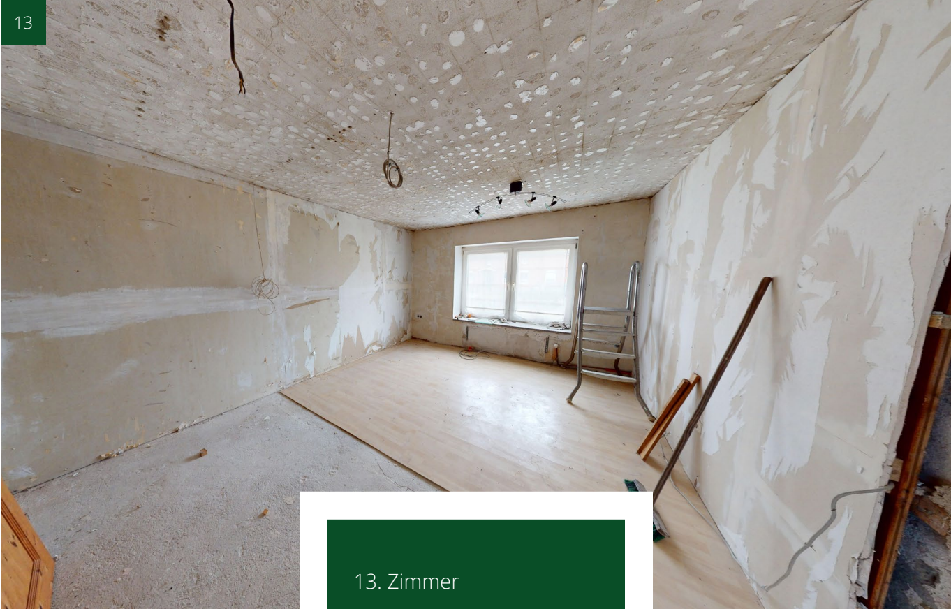
13. Zimmer 14. Dachboden