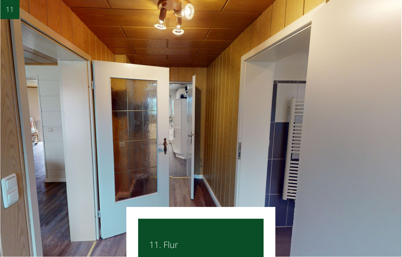
11. Flur 12. Wackküche