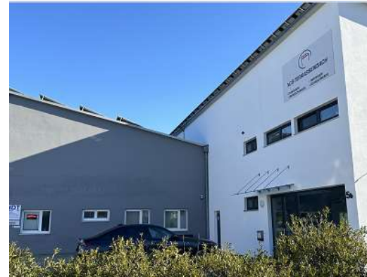
Eingangsbereich mit Parkplätzen