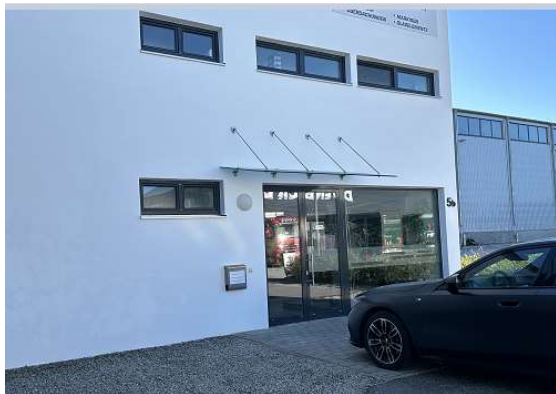
Eingangsbereich zu den Büros