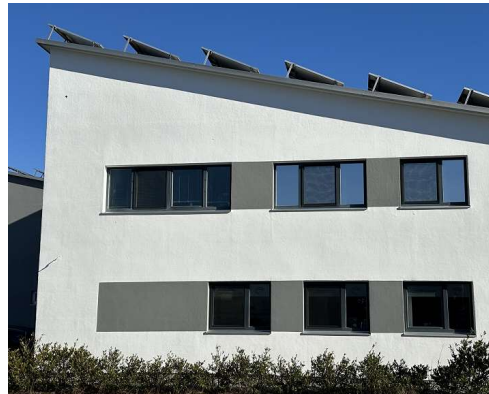
Seitenansicht Büros (Westseite)