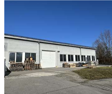
Hallenrückseite mit Rolltor