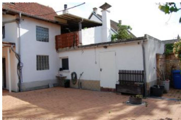
Blick zum Haupthaus